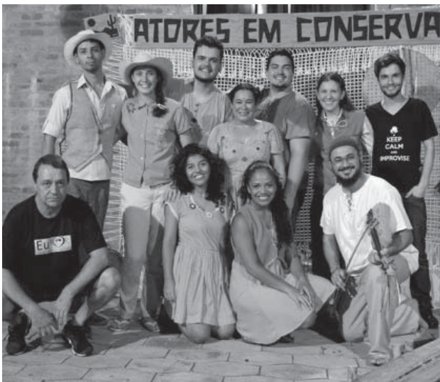
Atores em Conserva

Com agenda cheia, a companhia "Atores em Conserva" teve em fevereiro e março, seis apresentações, em Campinhas, Lençóis Paulista, Curitiba, entre outros.