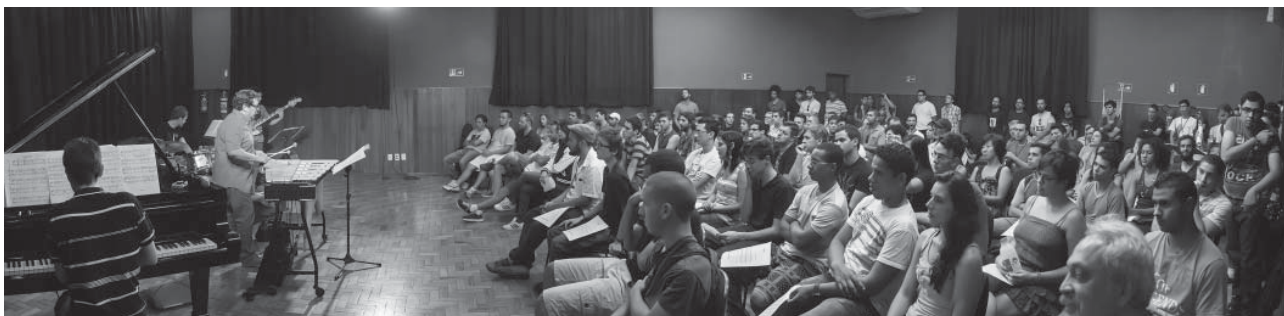
Masterclass no Salão Villa-Lobos

ensino à qual está relacionado em Valencia (Espanha), é liderado pelo vibrafonista, compositor e pedagogo Victor Mendoza. Trata-se de um dos artistas de maior reconhecimento internacional no jazz e no mundo da percussão na atualidade. Mendoza é, ainda, diretor do programa Masters of Contemporary Performance da Berklee College of Music, de Valencia, na Espanha.