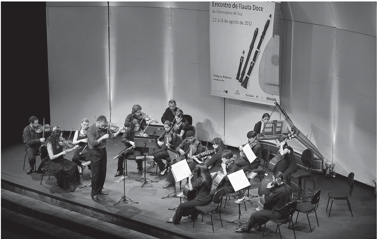
Orquestra do III Encontro Internacional de Performance Histórica