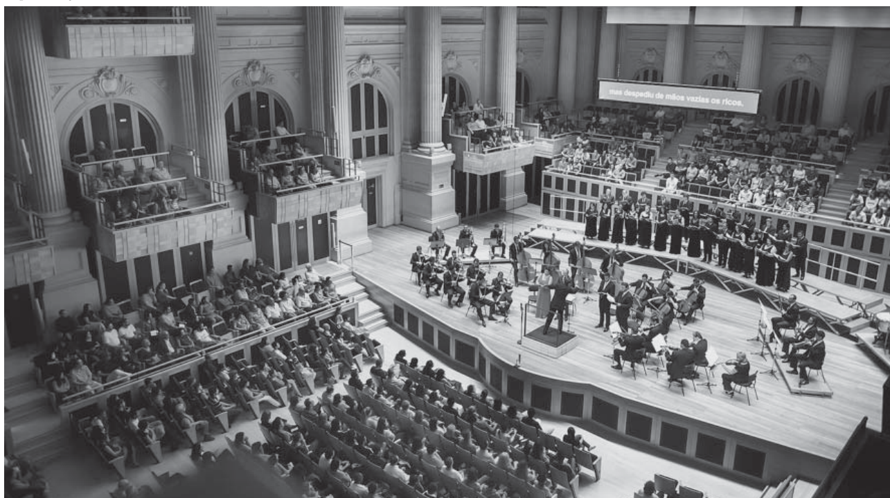
Orquestra Sinfônica do Conservatório de Tatuí

O Coro Sinfônico do Conservatório de Tatuí foi fundado em 1988 e é formado por cerca de 30 alunos bolsistas e professores-monitores da instituição. O grupo oferece aos estudantes uma ampla experiência do ambiente profissional voltado para a atividade coral. O Coro Sinfônico vem realizando apresentações importantes de repertório a capella, de música brasileira, repertório sinfônico e óperas. A apresentação deste dia 16 de fevereiro em São Paulo contará exclusivamente com participação de professores da instituição, todos integrantes da orquestra e do coro.