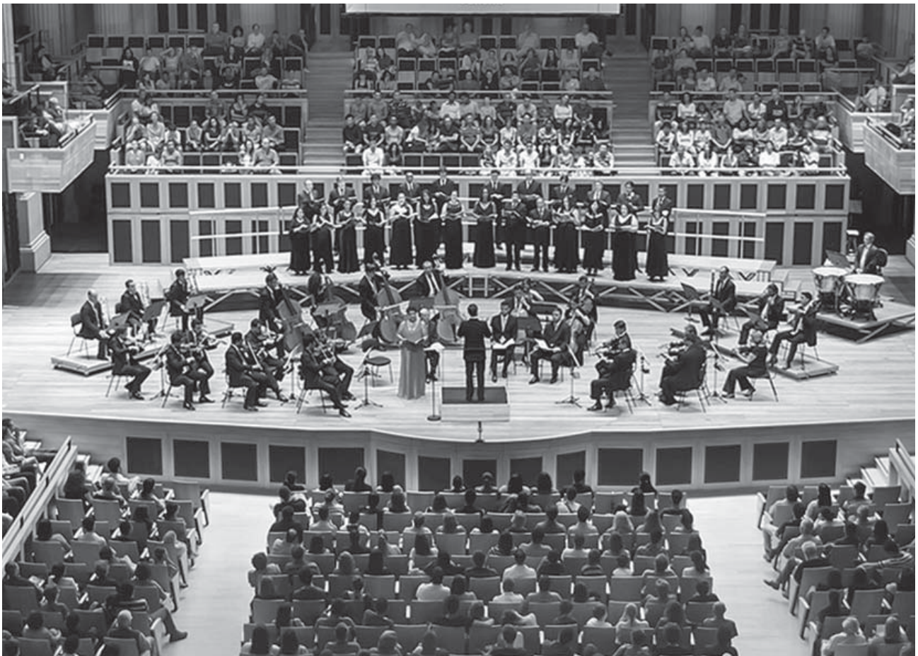
Orquestra Sinfônica do Conservatório de Tatuí no palco da Sala São Paulo