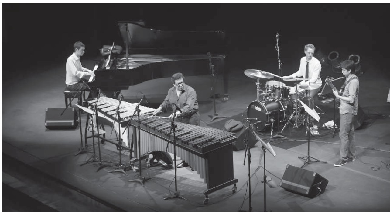
Berklee Valencia Quarteto